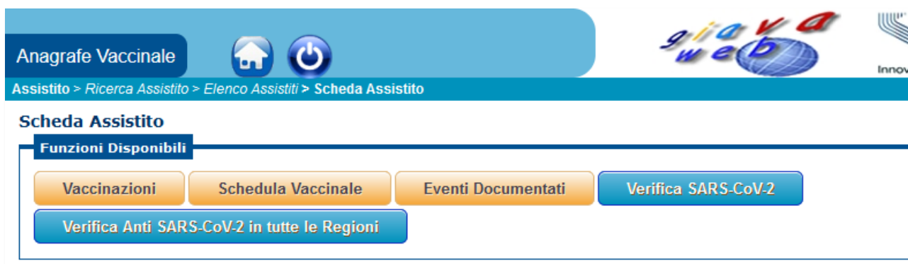
Figura 12 - Scheda Assistito - Verifica Somministrazione AntiSARS-Cov-2 in tutte le Regioni

Il controllo di eventuali somministrazioni erogate in altre regioni/province autonome è raccomandato anche in caso di assistiti del SSR della Puglia che dichiarano di aver ricevuto somministrazioni in altre regione/province autonome, non rilevabili in GIAVA.