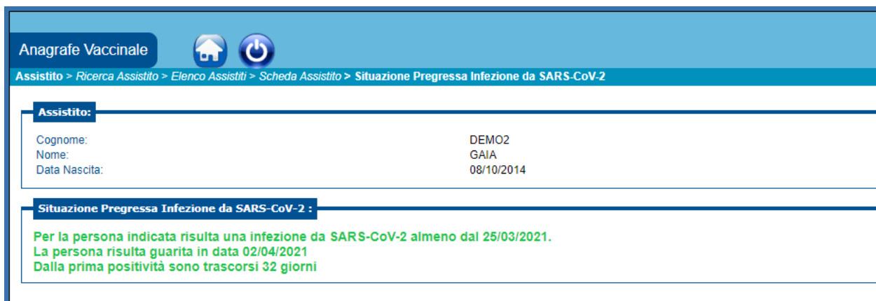
Figura 7 - Messaggio per assistito con pregressa infezione SARS-CoV-2 e attualmente guarito

In caso di pregressa infezione da SARS-CoV-2, la decisione sul numero delle dosi e, quindi, sulla necessità di una successiva somministrazione, deve essere presa in base ai contenuti delle circolari del Ministero della Salute 1 .