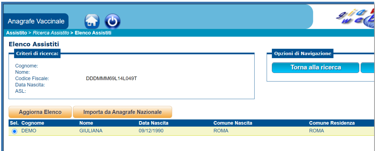
Figura 3 - Risultato "Cerca Assistito fuori regione" - Assistito presente in Anagrafe Nazionale

In tal caso è possibile importare in Anagrafe GIAVA i dati della persona cliccando sul comando Importa da Anagrafe Nazionale .