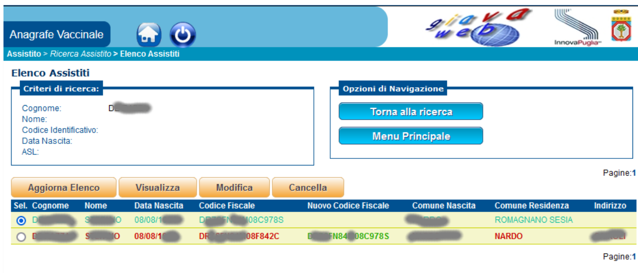
Figura 2 - Visualizzazione soggetti con Codice fiscale variato nel tempo

L'operatore dovrà registrare i dati della somministrazione vaccinale associandoli alla posizione anagrafica con il nuovo codice fiscale; l'operatore, ove a ciò sia abilitato, è tenuto altresì a riportare sulla posizione anagrafica aggiornata i dati delle somministrazioni già attribuite alla posizione obsoleta, cancellando successivamente le somministrazioni vaccinali assegnate alla posizione anagrafica obsoleta.