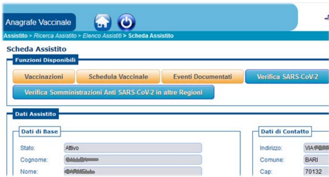
Figura 11 - Scheda Assistito - Verifica Somministrazione Anti SARS-Cov-2 in altre Regioni

Il controllo di eventuali somministrazioni erogate in altre regioni/province autonome è raccomandato anche in caso di assistiti del SSR della Puglia che dichiarano di aver ricevuto una prima dose in altra regione/provincia autonoma o per i quali non risultano in GIAVA somministrazioni anti-SARS-CoV-2.