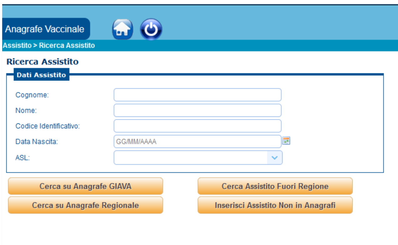
Figura 1 - Criteri di ricerca di una persona nelle anagrafi

La ricerca può avvenire secondo i criteri visualizzati nella pagina Ricerca Assistito mostrata di seguito.